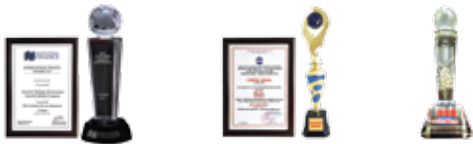
Giải thưởng Dịch vụ Khách hàng Tốt nhất 2017

Generali Việt Nam cam kết mang đến những giải pháp bảo hiểm chất lượng hàng đầu thông qua các sản phẩm cải tiến ưu việt có mặt tại mạng lưới phục vụ rộng khắp hướng đến trải nghiệm tích cực cho mọi khách hàng. Công ty tiếp tục khẳng định uy tín thương hiệu qua việc đón nhận các giải thưởng danh giá như: